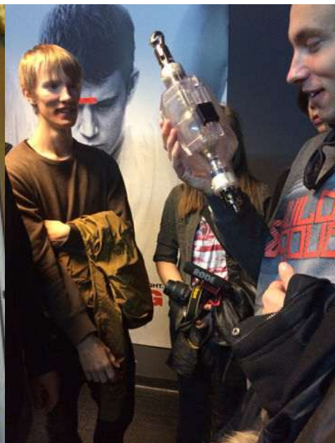
ERASMUS+ Kauņa, Lietuva