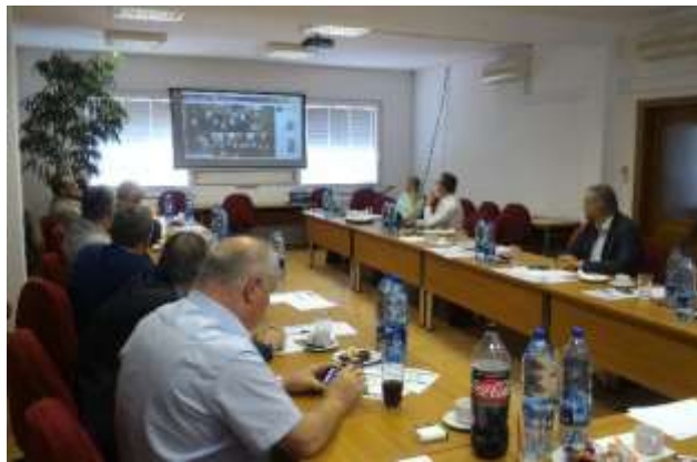
Slovākijas nacionālā skillME konference 2017.gada 6.oktobrī, Pezinokā (Slovākija)