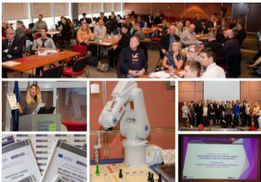
Starptautiskā skillME konference 2017.gada 4.oktobrī Ļubļanā, Slovēnijā.

Konferences mērķis bija prezentēt labas prakses un inovatīvas pieejas prasmju trūkuma novēršanā, pielīdzinot iegūstamās prasmes darba tirgus prasībām, attīstot jaunas prasmes jaunai nodarbinātībai un pielāgojot nacionālās stratēģijas, lai uzlabotu profesionālās izglītības un apmācību kvalitāti un efektivitāti un paaugstinātu darbinieku konkurentspēju. Tika prezentētas dažādas pieejas profesionālās izglītības stiprināšanā un izstrādāto mācību programmu ieviešanas nacionālās stratēģijas skillME projekta dalībvalstīs – Slovēnijā, Slovākijā, Latvijā un Horvātijā. Papildus tam, pasniedzēji un audzēkņi pastāstīja par savu pieredzi pilotapmācību ieviešanas laikā un demonstrēja apmācību piemērojamību un rezultātus, balstoties uz Tehniskās redzes apmācību programmu – kameru pielietošana robotu vadībai, ko prezentēja audzēkņi no Stará Turá Tehniskās vidusskolas. Vairāk informācijas par konferenci projekta mājas lapā .