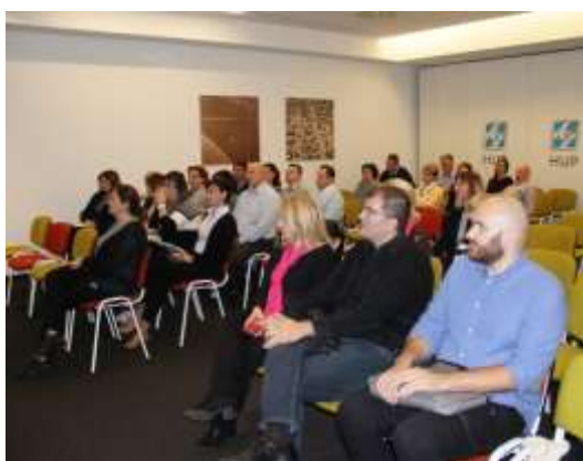
Horvātijas nacionālā skillME konference 2017.gada 29.septembrī, Zagrebā (Horvātija)

Projekta partneri visās dalībvalstīs organizēja arī nacionālās konferences , lai prezentētu projekta rezultātus un sasniegto ieinteresētajām pusēm. Konferences izraisīja lielu interesi un tās apmeklēja liels skaits uzņēmumu, kuri ir ieinteresēti savu darbinieku apmācībā, profesionālās izglītības iestādes, kas ir ieinteresētas audzēkņu apmācību ieviešanā, kā arī citi.